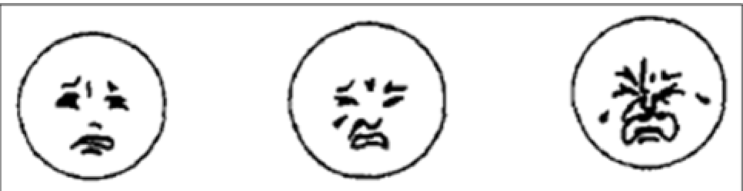
kaart D: matige pijn tot ernstige pijn