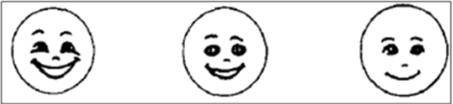
kaart B: geen pijn tot (mogelijk) milde pijn

"Welk gezichtje past het beste bij hoe jouw pijn van binnen voelt?"