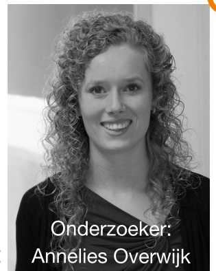
Onderzoeker: Annélies Overwijk

Ook vragen we aan begeleiders wat ze nodig hebben om mensen met een verstandelijke beperking (VB) te helpen met gezonde voeding en beweging.